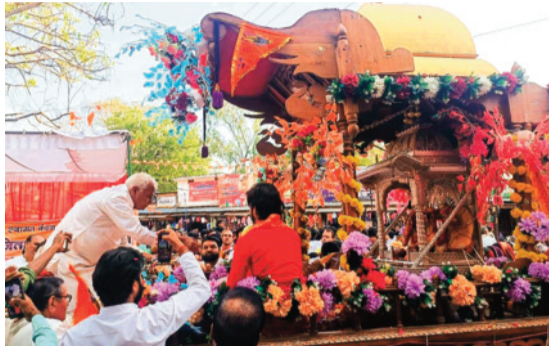
हरिभूमि न्यूज | अशोकनगर

जन जन के आराध्य प्रभु श्रीराम भारत की आत्मा में वसते हैं, रामनवमी का मौका हो तो शहर के श्रद्धालु प्रभु श्रीराम की भक्ति में डूबे देखे गए, रामनवमी के अवसर पर पूरा शहर राममय होता नजर आया। सुबह से ही शहर के मंदिर जन आस्था के केन्द्र बने रहे। दोपहर में भगवान की भव्य शोभायात्रा निकली, प्रभु श्रीराम शहर के भ्रमण पर निकले, जगह-जगह श्रद्धालुओं ने जन-जन के आराध्य प्रभु श्रीराम की आरती उतारी। भक्ति भाव से शहर की सड़कों पर निकले इस चल समारोह में शामिल लोगों का अनेक संस्थाओं ने स्वागत किया। अशोकनगर शहर धार्मिक पर्व उत्साह पूर्वक मनाने के लिए जाना जाता है। देवी मां की नौ दिनों तक की जाने वाली आराधना के बाद राम नवमी का पर्व प्रभु श्रीराम के जन्मोत्सव के रूप में मनाया गया। शहर के राम दरवारों में प्रभु श्रीराम के भक्तों ने सुबह से ही मंदिरों में पहुंचकर भगवान राम की जय-जयकार की, आराधना और उपासना के आयोजन हुए, श्रद्धालुओं ने भगवान के दरबार में बैठकर घंटों आराधना की, राम भक्ति का अनुपम उदाहरण पेश किया। शहर के राम दरवारों में आसमानी माता मंदिर,